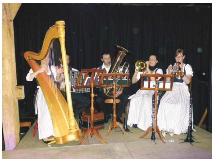
Für die musikalische Umrahmung der Verabschiedung sorgten die Samerberger Musikanten von „Honigbrot“.