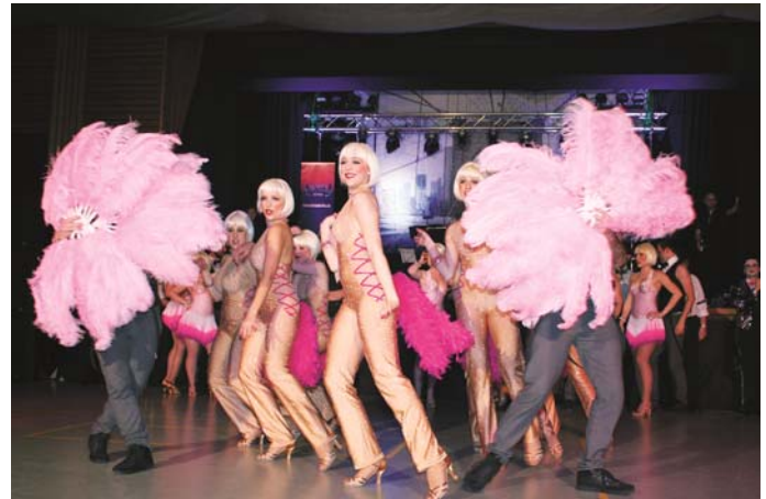
„La Grande Revue - Rosenheim goes Burlesque“. Das Motto der Rosenheimer Garde