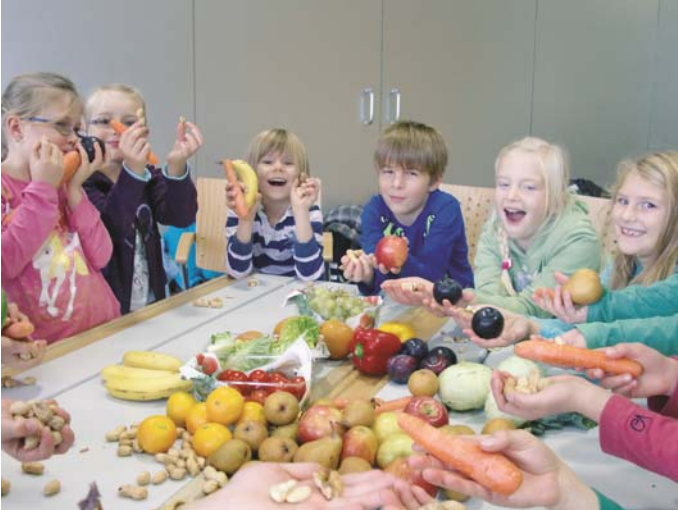
Je bunter, desto besser