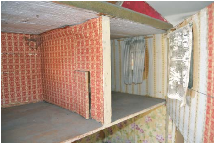
Jedes Zimmer im hier geöffneten Puppenhaus ist mit einer anderen Tapete liebevoll ausgekleidet.

Text und Foto: Franz Hausstetter, GTEV „Achtentaler“ Rohrdorf