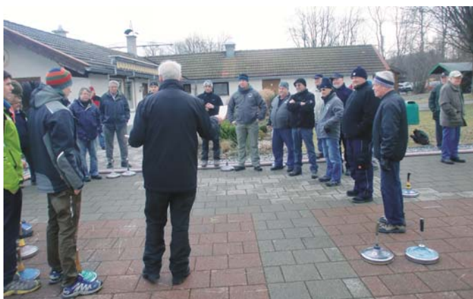
Vor dem Turnier erfolgte eine Einweisung für alle Teilnehmer