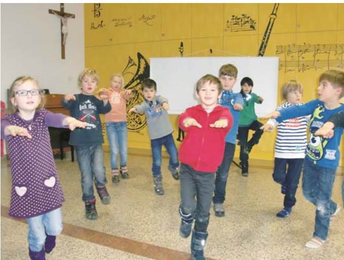
Energie für den Schultag

Redaktionsschluss für redaktionelle Beiträge in der Aprilausgabe: Samstag, 15. März 2014 rsz@rohrdorf.de rsz@samerberg.de