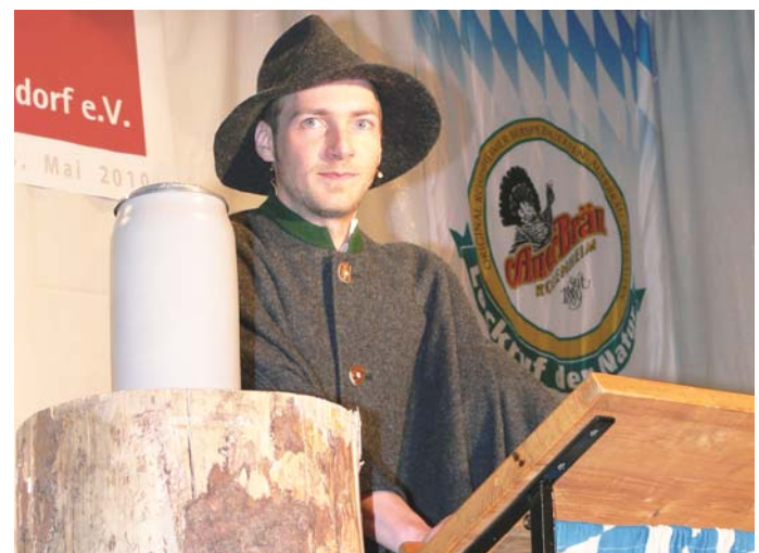
Was hat Nachtwächter „Gwaxe“ dieses Jahr zu berichten?