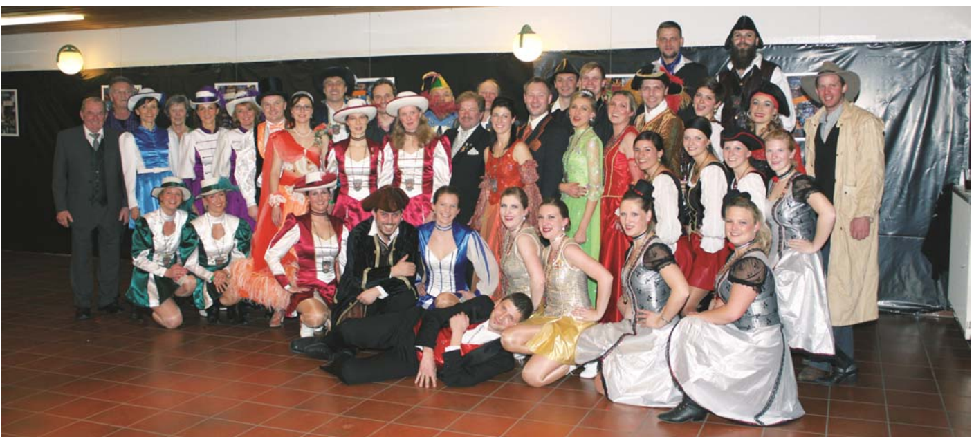
40 Jahre RFG – Ehemalige Aktive des Vereins am Gildeball

Die Band „Nebrasska“, die den gesamten Abend musikalisch gestaltete, schaffte es wie immer viele Gäste in den Programmpausen auf die Tanzfläche zu locken. So verging die Zeit bis zum zweiten Showteil des Abends recht schnell. Dieser wurde eingeleitet von der Faschingsgilde Aschau, die