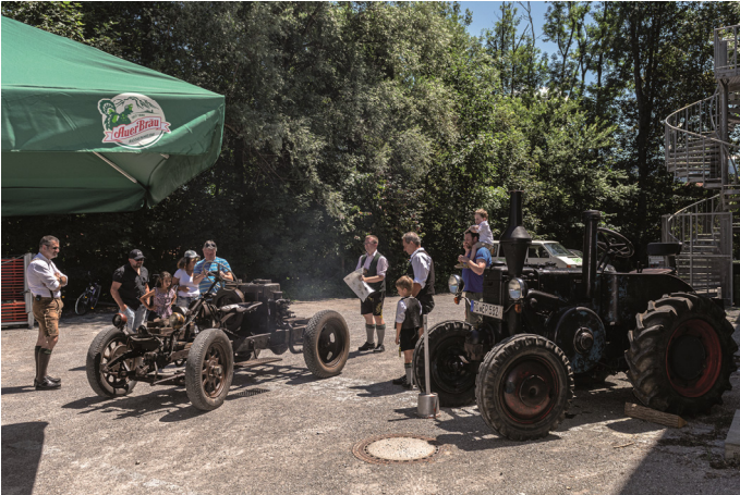
Spektakulär – die Neuerwerbung beim Tag der offenen Tür

Hopfen- und Traubenfest, Stadtfest und Tag der offenen Tür