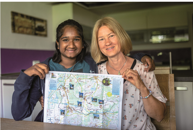
Die zum Projekt gehörende selbstgestaltete Radwanderkarte mit den einzelnen Ankerpunkten