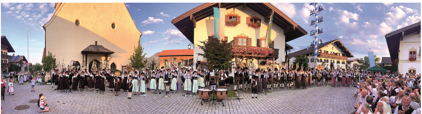
Die Musikkapellen beim Musikantengruß von links nach rechts: Musikkapelle Samerberg, Musikkapelle Rohrdorf, Musikkapelle Neubeuern, Musikkapelle Nußdorf