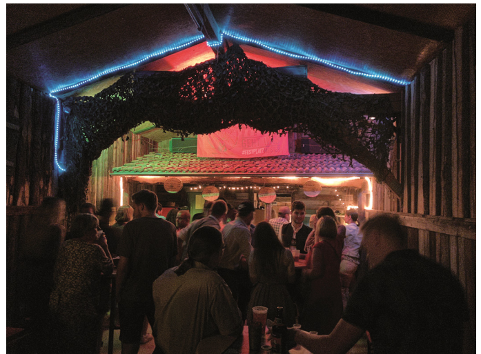
Ausklang an der Bar

Auch das Sommerfest in Thansau hatte nach zwei Jahren Corona-Pause noch mehr Zulauf als sonst. Das Fest dort, ein richtiges Ganz-Tages-Erlebnis, denn Beginn war schon um sechs Uhr morgens mit dem Flohmarkt, ergänzt ab zehn durch ein Schafkopfturnier. Am Nachmittag dann der Start des Zeltbetriebs mit der Sechs-Zylinder-Musi. Viele Besucher blieben bis spät in die Nacht, um an der Bar den Abend ausklingen zu lassen. Was wieder einmal klarmacht: es sind solche Feste, die einen Ort zusammenhalten, fehlen sie, fehlt etwas ganz Entscheidendes.