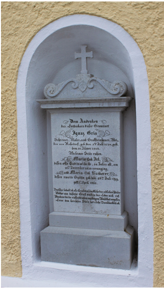
Grabstelle mit dem Rohrdorfer Marmor

viele dürften wissen, dass die Kalksteinkonglomerate, die hier zu finden sind, einst – nämlich in der ersten Hälfte des 18. Jahrhunderts – ein begehrter Baustoff waren. Der sogenannte Rohrdorfer Granitmarmor diente nämlich als Ersatz für echten italienischen Marmor. Dieser war in Zeiten, in denen es noch kein Bahnnetz gab, so gut wie nicht nach Deutschland zu bringen, jedenfalls nicht in den Mengen, die man für größere Bauwerke brauchte. Der Rohrdorfer Marmor war deshalb auch für viele Repräsentationsbauten in München der Baustoff der Wahl.