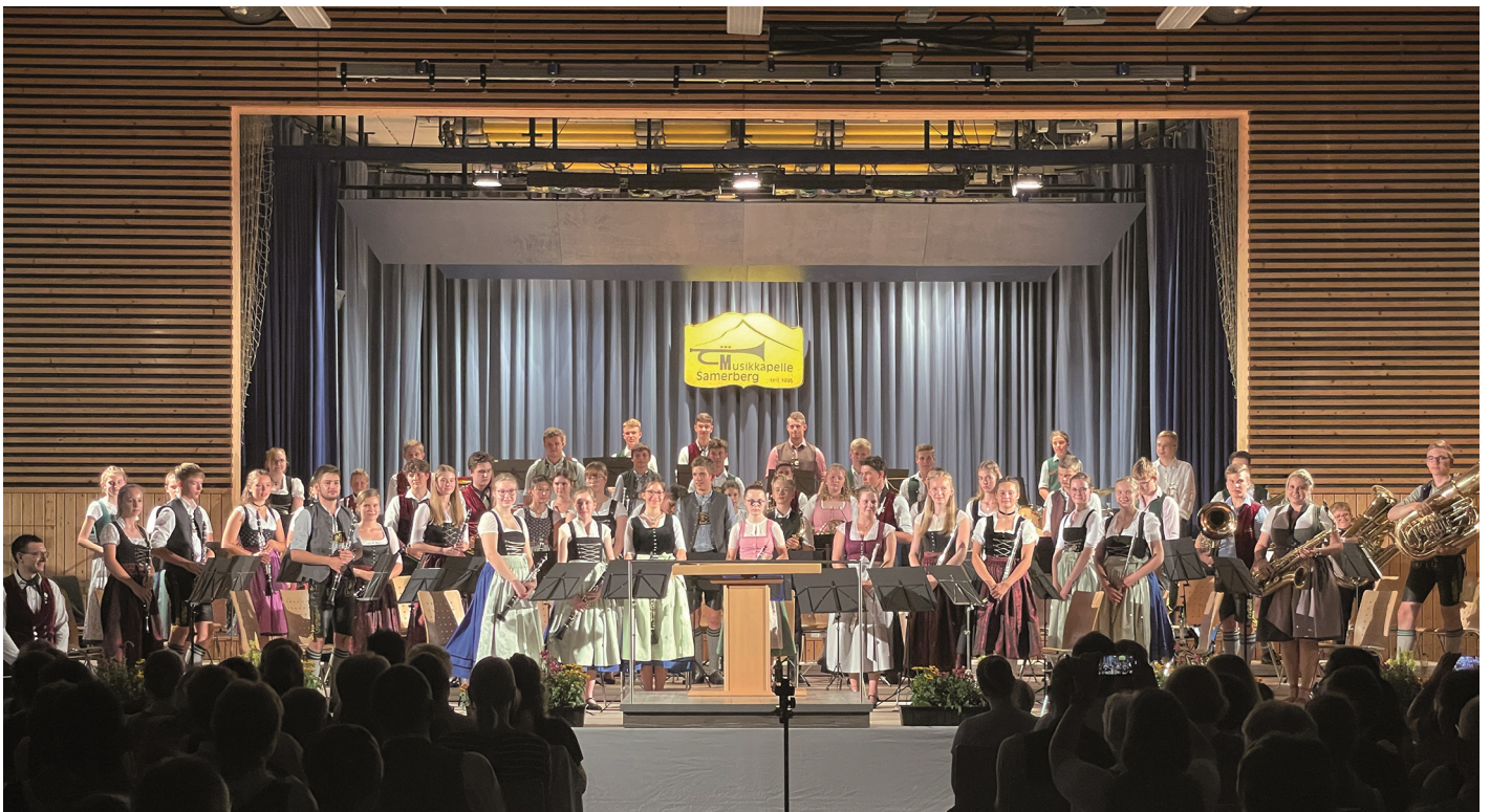
Den Höhepunkt des Konzertabends bildete der zweite Teil, bei dem die drei Jugendkapellen gemeinsam auf der Bühne musizierten.

So macht es richtig Freude wieder spielen zu dürfen.