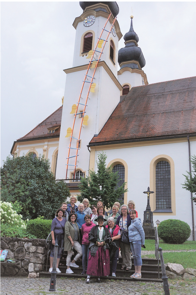
Die Schropperin umringt von den Lauterbacher Frauen vor der Aschauer Kirche mit der leuchtenden Himmelsleiter