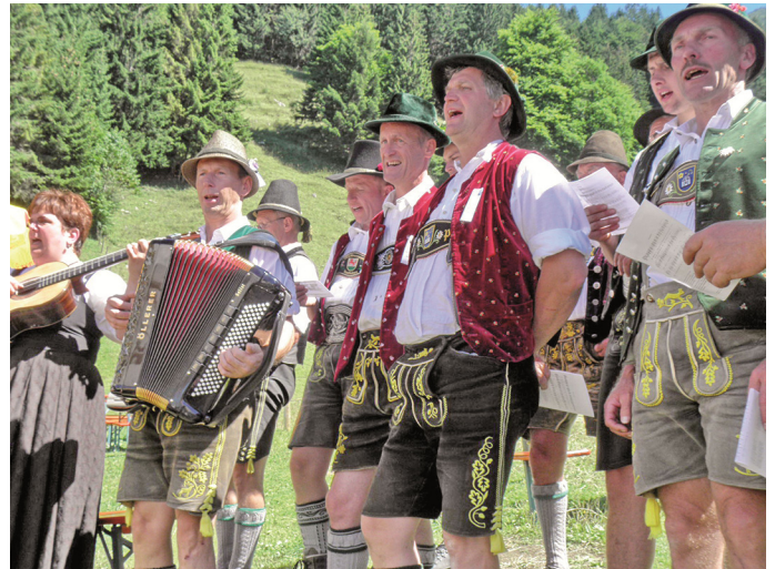
Archivbild von 2010

Beginn mit Bergmesse am 07. August um 11 Uhr