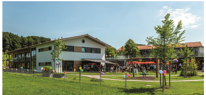
Der neue Samerberger Kindergarten fügt sich hervorragend in das Gelände ein.