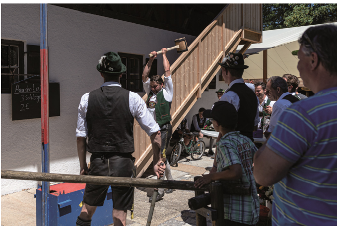
Hau den Lukas

„Endlich wieder“. Diesen Stoßseufzer der Erleichterung konnte man in den letzten Wochen öfters in ganz Rohrdorf hören, denn nach zwei düren Jahren gab es endlich wieder die schwer vermissten Sommerfeste. Den Anfang machte der GTEV Achentaler Rohrdorf mit dem Hopfen- und Traubenfest am Freitag der vorletzten Juniwoche, gefolgt vom Stadtfest mit Tag der offenen Tür im Heimathaus am Sonntag. Beide Tage waren gut besucht, sogar etwas mehr noch als in den Jahren vor Corona: Der Nachholbedarf am Zusammensitzen, Essen, Trinken, Ratschen und sich von einer zünftigen Musi unterhalten zu lassen ist eben groß. Der Sonntag bot dann bei allerbestem Wetter nicht nur die Gelegenheit zum Tanz, sondern auch noch ein paar Highlights nebenher. Guten Zulauf hatte immer wieder der Hau den Lukas, viel Publikum aber auch die Neuerwerbung des Bauernmuseums, ein selbstgefertigter Traktor aus den dreißiger Jahren, aufgebaut auf dem Fahrgestell eines Horch, damals eine Nobelmarke ersten Ranges. Zu sehen auch die fabrikgefertigte „Konkurrenz“, ein alter Lanz.