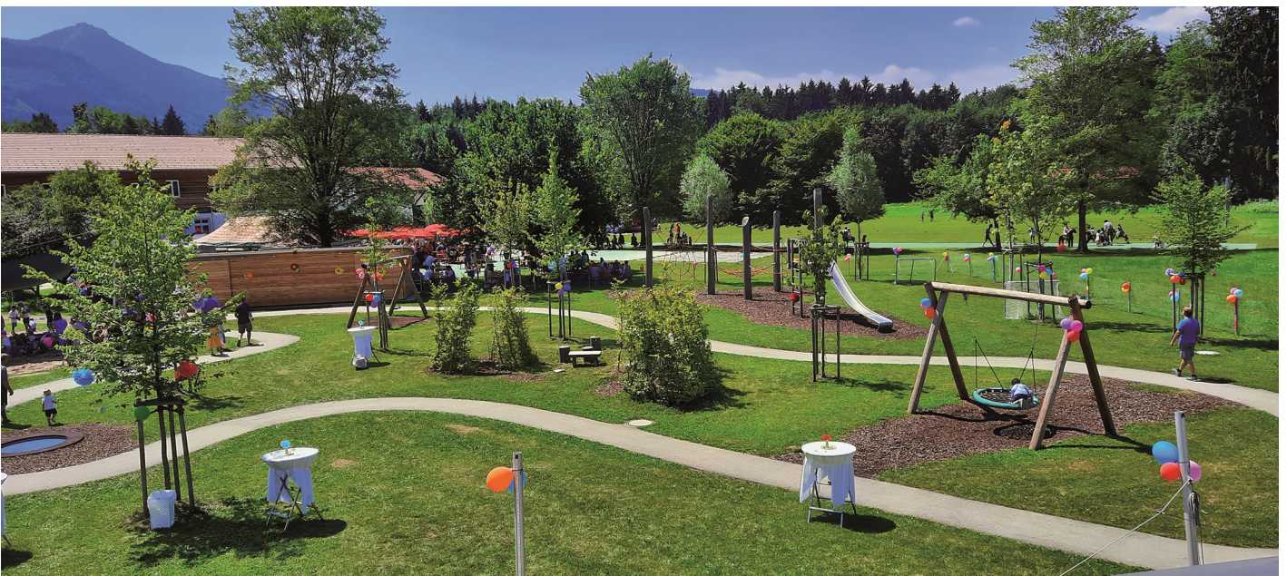
Die Außenspielfläche wurde großzügig gestaltet. „Ein Paradies für Kinder“, so die Meinung der Besucher.