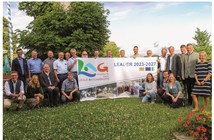
Die neue Vorstandschaft mit Entscheidungsgremium für die kommende Förderperiode 2023 bis 2027