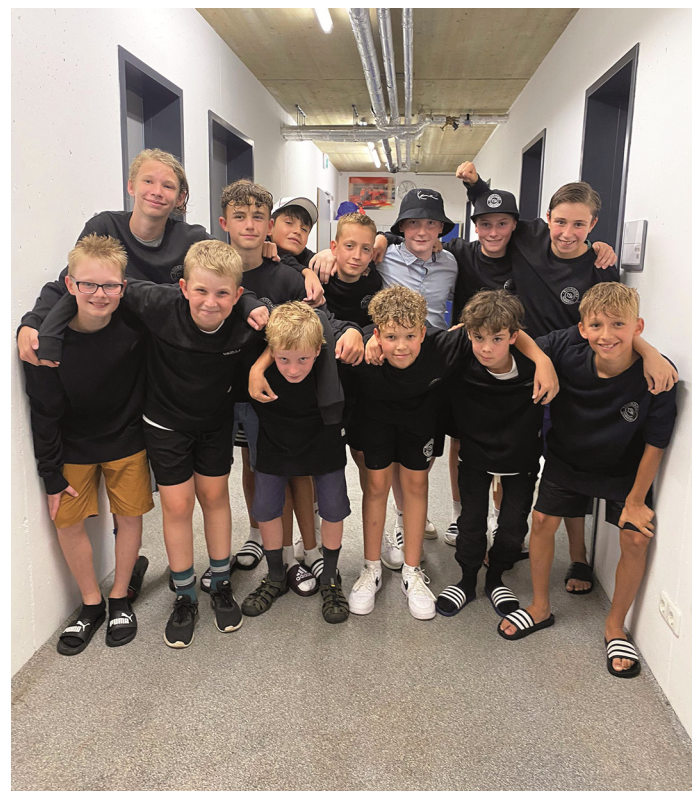
Als Belohnung bekamen die Jungs alle einen TSV Rohrdorf-Thansau Pullover

Text/Bilder: TSV Rohrdorf-Thansau Abtlg. Fußball