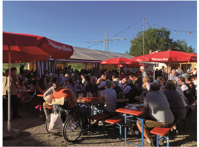
Gemütlich war's bei der Thansauer Dult und das Wetter passte auch

Auch das Sommerfest in Thansau hatte nach zwei Jahren Corona-Pause noch mehr Zulauf als sonst. Das Fest dort, ein richtiges Ganz-Tages-Erlebnis, denn Beginn war schon um sechs Uhr morgens mit dem Flohmarkt, ergänzt ab zehn durch ein Schafkopfturnier. Am Nachmittag dann der Start des Zeltbetriebs mit der Sechs-Zylinder-Musi. Viele Besucher blieben bis spät in die Nacht, um an der Bar den Abend ausklingen zu lassen. Was wieder einmal klarmacht: es sind solche Feste, die einen Ort zusammenhalten, fehlen sie, fehlt etwas ganz Entscheidendes.