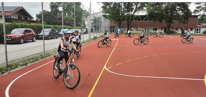
Üben auf sicherem Gelände